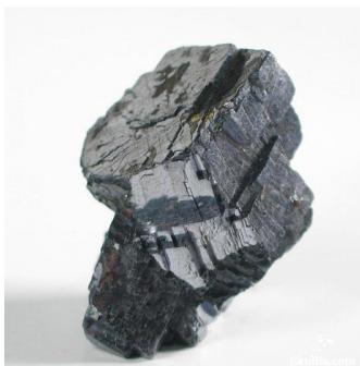
looduslik grafiidikristall . Pildi allikas.